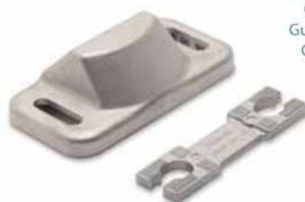
P Guía lado cierre Guide / Closing side Guide fermeture