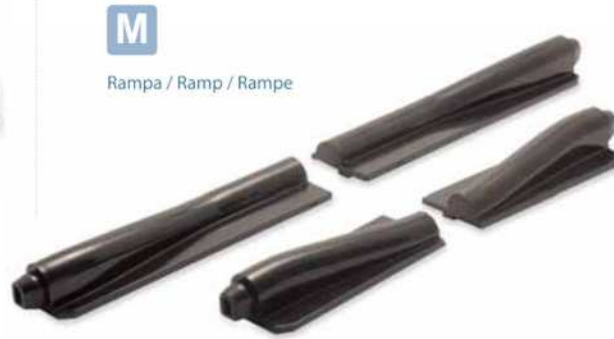
M Rampa / Ramp / Rampe