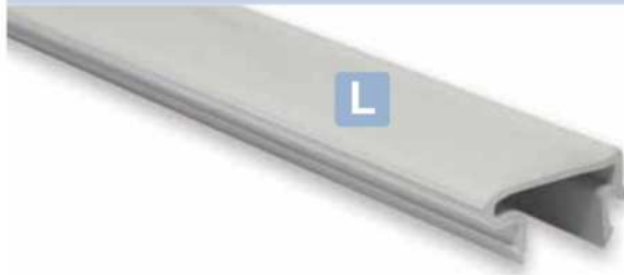
L Tapa Rail superior Rail upper cover Cache supérieur de rail