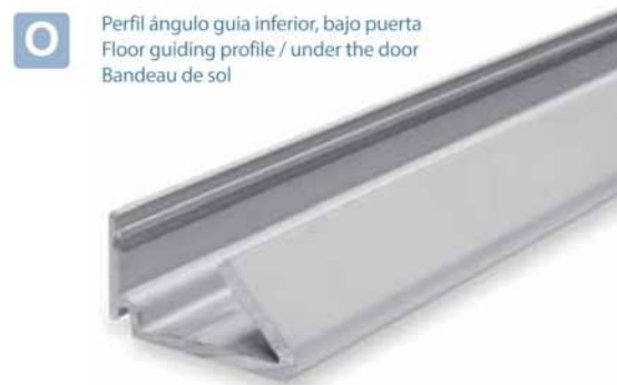
O Perfil ángulo guía inferior, bajo puerta Floor guiding profile / under the door Bandeau de sol