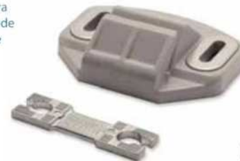
Q Guía lado apertura Guide / Opening side Guide ouverture